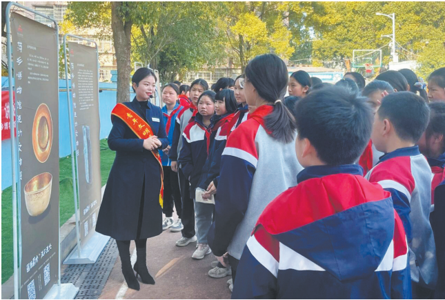
萍乡博物馆送展进校园

兴趣；“百馆下基层”活动将文博课程送进校园，增强学生对本土文化的认同；国际博物馆日、文化和自然遗产日等重大节点活动形式新颖，吸引公众广泛参与；“文物修复开放日”活动揭开了文物保护的神秘面纱，传承弘扬工匠精神。全年开展“蛇舞新春 趣享年味”“多彩端午 乐在萍博”“家国同辉”巧艺庆双节等传统节日主题活动近百场，营造浓厚文化氛围的同时，有效发挥了博物馆“第二课堂”和文明殿堂的作用。