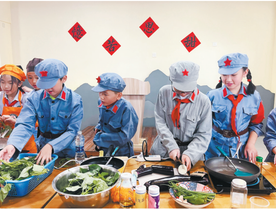
孩子们参与“丰收节”主题课

此外，还围绕重大纪念活动和重要纪念日等展开“大思政课”授课。在庆祝中国共产党成立100周年之际，向青少年展示并讲述馆藏革命漫画与宣传标语，策划“我心中的党·心中的祖国——百名少儿书法绘画”活动，孩子们走进场馆现场创作；在第46个国际博物馆日，策划推出“‘福’印在我心中——青少年红色主题印文篆刻”课程，依托馆藏革命文物“中央苏区印章”，以篆刻艺