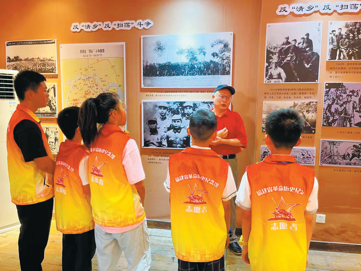
新四军后代为小志愿者开展讲解培训

福建省革命历史纪念馆于1998年11月开馆，先后获评全国爱国主义教育示范基地、国家国防教育示范基地、全国首批“大思政课”实践教学基地等，是福建省思政教育的主阵地之一。近年来，纪念馆积极联动社会资源，尤其注重搭建馆校交流平台与长效合作机制，“‘一起来’教育活动——探索打造纪念馆社会教育新路径”入选2022年度全国文博社教百强案例名单，福建革命文物主题课程现场教学入选以革命文物为主题的“大思政课”优质资源建设推介精品项目名单等，探索出一条共建“红色纪念馆学校”的实践路径。