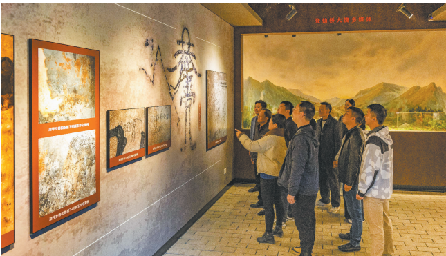
观众在乐安县红军标语博物馆参观

社会教育活动品牌化、系列化特征显著。全年提供讲解服务402批次，举办社教活动94场（计150场次），下辖的萍乡孔庙博物馆举办活动171场次。品牌项目“萌萌课堂”“暑期文化乐园”紧密衔接学校教育，通过沉浸式体验激发青少年对传统文化的