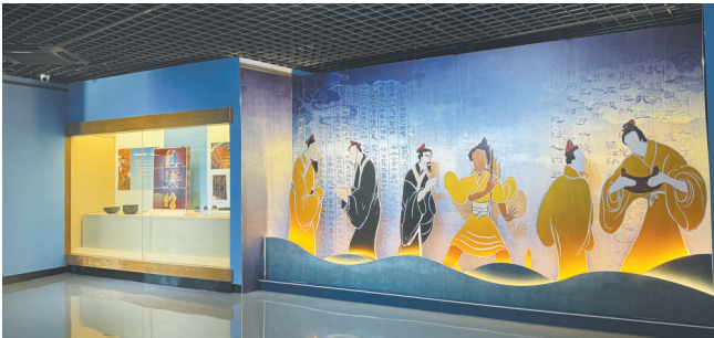
赣地宝藏——新时代江西文物成果展