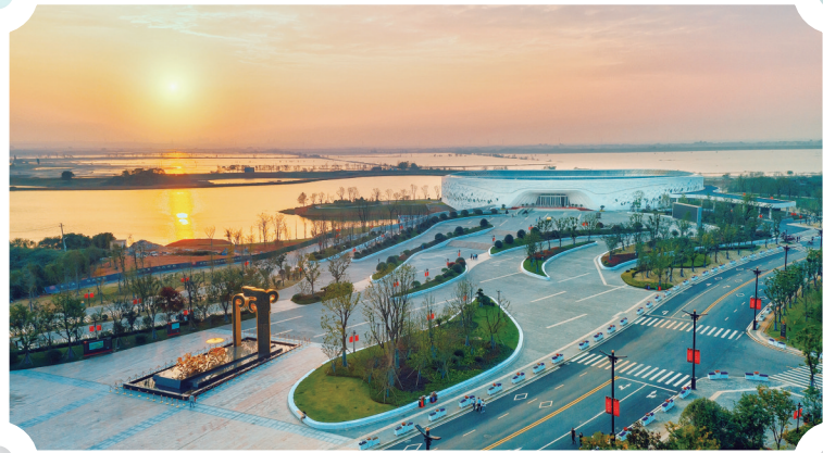
江西汉代海昏侯国国家考古遗址公园