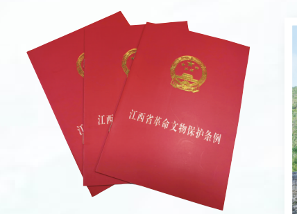
江西省革命文物保护条例