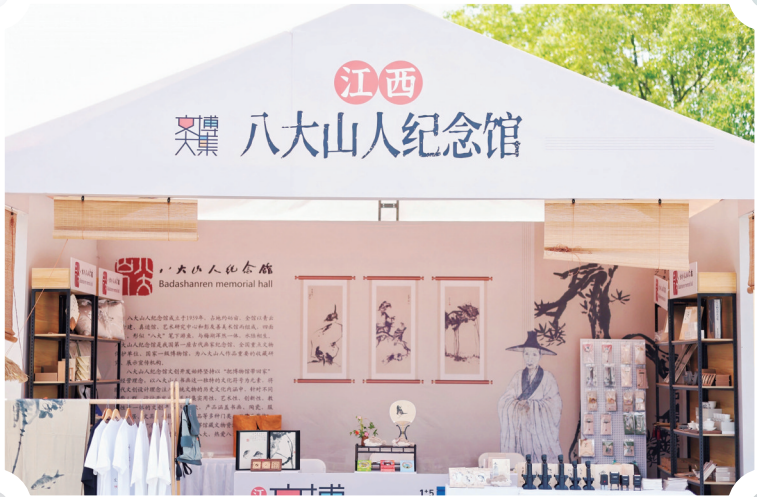
江西文博大集上的八大山人纪念馆展位