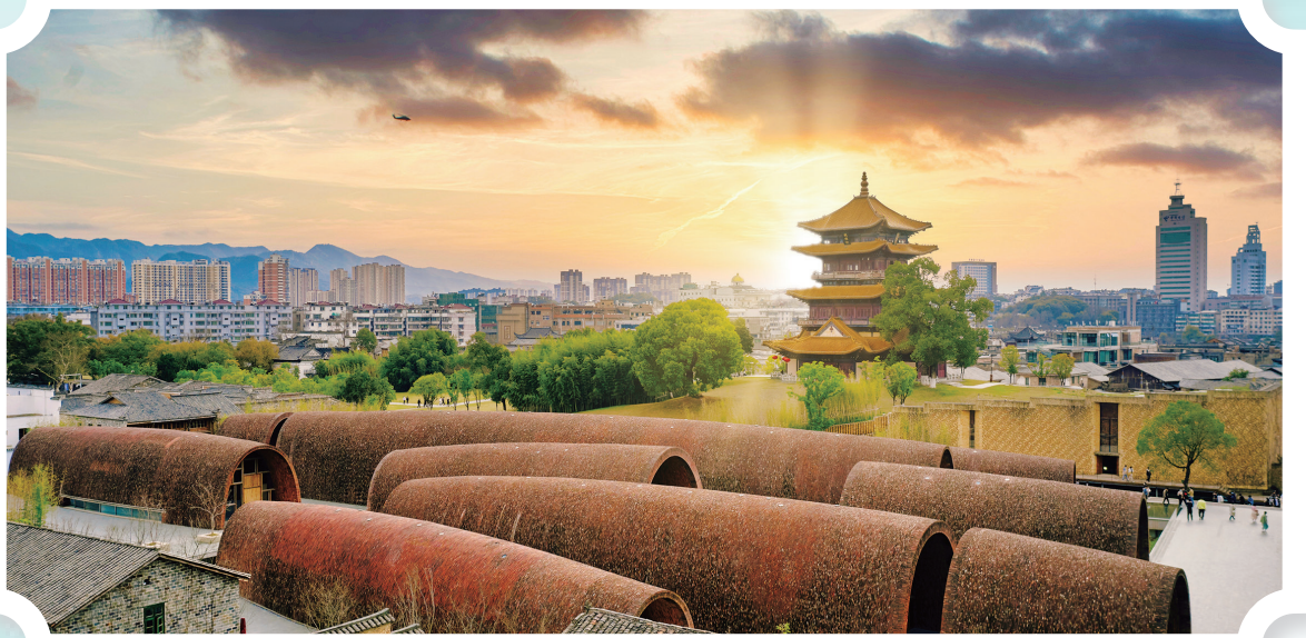
景德镇御窑博物馆