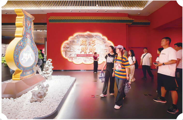
江西省博物馆“故宫厅”