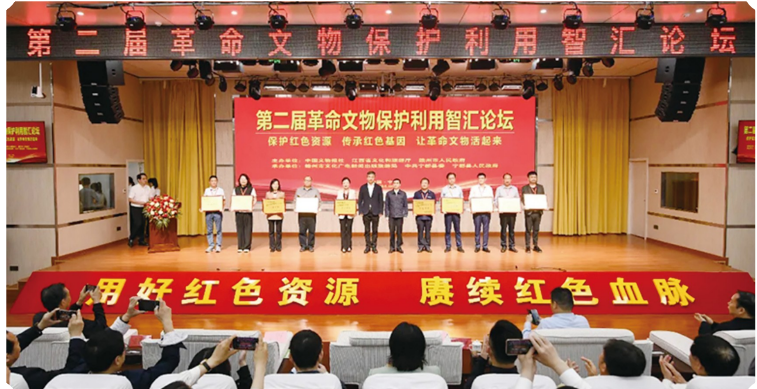
第二届革命文物保护利用智汇论坛