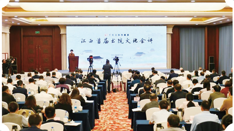
江西首届书院文化会讲