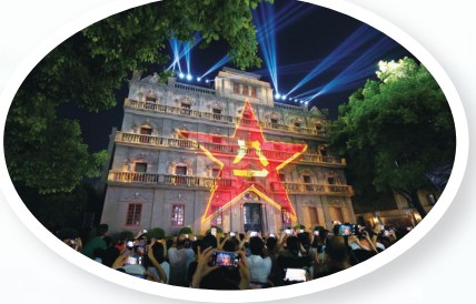
“光影八一”灯光秀现场