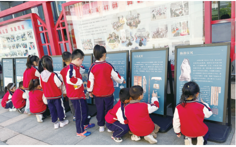
流动图片展走进学校