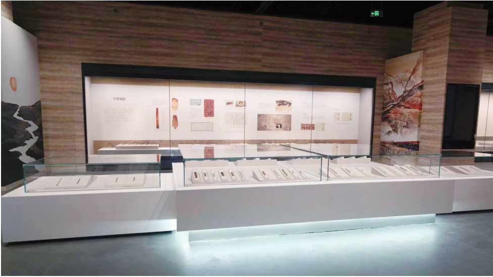
“‘简’读居延——居延遗址出土汉简专题展”展厅