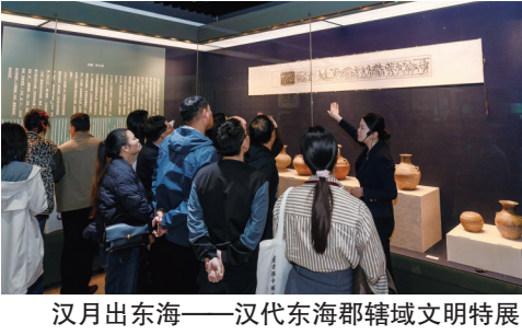
汉月出东海——汉代东海郡辖域文明特展

“尹湾汉简”作为西汉时期珍贵历史文献,其独特历史价值与文化意义获国内外学术界高度认可。2002年,“尹湾汉简”已列入《中国档案文献遗产名录》。为提升其国际影响力,2024年8月,组织申报了《世界记忆名录》,努力将其推向世界。同年11月,与江苏电视台合作拍摄了《中国档案文献关于“尹湾汉简”的专题宣传片》,并在江苏卫视播出。2025年9月,国家档案局联合连云港市博物馆、山东博物馆、湖北省博物馆、四川省成都市文物考古研究院、云南省文物考古研究所、甘肃简牍博物馆、湖南省博物馆等