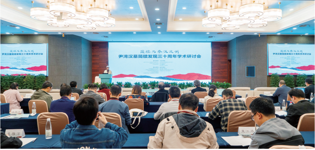
“简牍与秦汉文明——尹湾汉墓简牍发现三十周年”全国学术研讨会