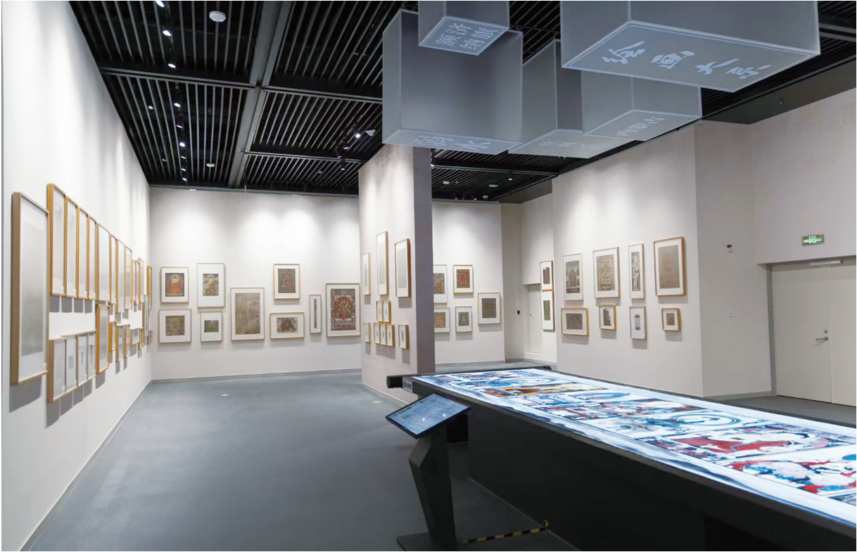
“盛世修典——‘中国历代绘画大系’成果展·黑水城遗珍——俄藏黑水城出土绘画专题展”展厅

面向未来，荆州简的保护传承工作有着清晰的规划与愿景。正如湖北省文物局局长陈飞所言：“站在纪南城考古六十周年的历史节点回望，荆州简的发现与研究，不仅实证了荆楚文化的深厚底蕴，更彰显了中华文明的源远流长、博大精深。这些墨书于竹木上的文字，是楚人的智慧结晶，是中华文明的重要载体，更是连接古今的精神纽带。未来，随着保护技术的不断进步、研究深度的持续拓展、传播方式的创新升级，荆州简必将绽放出更加耀眼的光芒，为建设文化强国、传承中华文脉提供坚实支撑，让楚韵华章在新时代焕发出不可朽生机。”