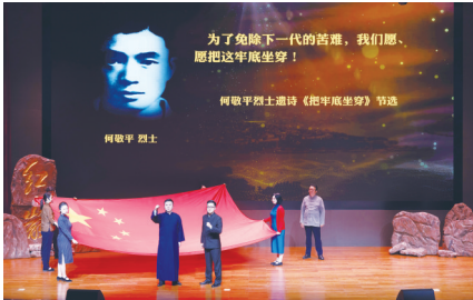
《红岩革命故事展演》在重庆红岩干部学院开展驻场演出

党性教育和思政教育课程建设有其内在规律。红岩博物馆严格遵循课程研发规范，坚持高标准、严要求，在《红岩革命故事展演》框架搭建、文稿撰