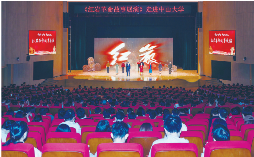
《红岩革命故事展演》走进中山大学

作为革命博物馆和党性教育干部学院，红岩博物馆有藏品10万余件（套），其中珍贵可移动文物4000余件（套）。博