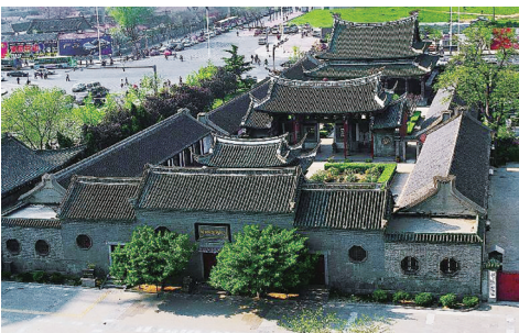
烟台福建会馆全景

层破损较严重，木构件暴露、彩画不完整。彩画的颜料层粉化脱落等病害造成图案不完整和模糊不清，并日趋严重。