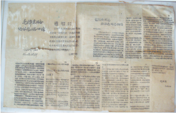
毛泽东著《星星之火，可以燎原》