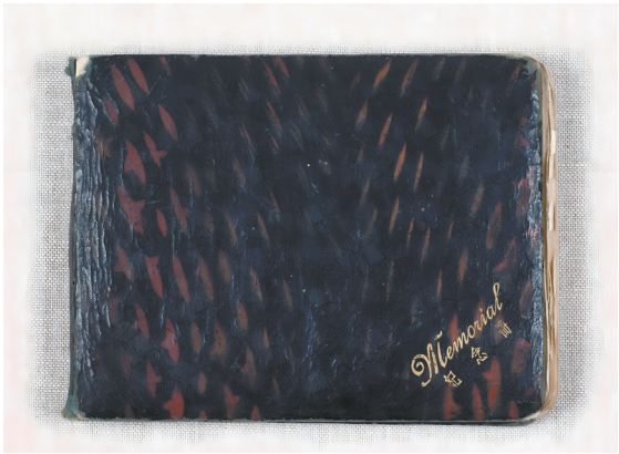
杨荆石烈士的纪念册