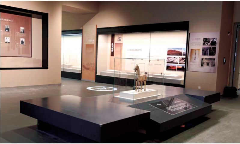
“‘简’读居延——居延遗址出土汉简专题展”展厅一角

的技法风格,主要描绘了佛教故事、历史人物与日常生活等场景,展现了古人的信仰世界、礼仪风俗、审美理念和人文情怀。 两展将持续至2026年3月15日。 居延汉简研究保护与活化利用学术座谈会暨《“简”读居延》丛书