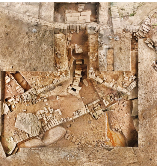
重庆市合川区钓鱼城遗址

(上接1版) 海洋文化守护,破解海上丝绸之路的千年密码。发现世界级重大考古发现——南海西北陆坡一号、二号沉船,国务院首次划定公布南海西北陆坡一号、二号沉船水下文物保护单位,完成南海西北陆坡一号、二号沉船考古调查工作和一号沉船2025年考古发掘项目,928件(套)出水文物重见天日,见证着古代海上贸易的繁荣。配合第四次全国文物普查,实施环海南岛近海(内水)水下文化遗产调查、西沙海域水下文化遗产调查等,全面厘清相关海域的水下文化遗产保存状况,实现对水下文化遗产从近海到远海,从浅海到深海的系统保护。 民俗文化传承,推动海南热带雨林和黎族传统聚落申报世界遗产。印发《海南省黎族传统聚落文化遗产保护管理办法》《黎族传统聚落建设导则》,完成海南黎族传统聚落突出普遍价值研究,组织实施白查村船型屋、初保村民居、洪水村金字茅屋修缮工程。 推进第四次全国文物普查,按期完成实地调查任务。新发现南或河遗址、莺歌海秘密联络站、国营海南光华厂等系列不可移动文物,完善海南文物谱系,填补部分资源空白。围绕黎族传统聚落、东坡足迹、水下文化遗产等开展专项调查。“四普工作成效”纳入海南省市县年度高质量考核,以文物普查为契机,为全省4000多处不可移动竖立文物标识。 博物馆发展提质效 文化惠民成为幸福底色 海南以“数量增长、质量提升、功能完善”为目标,构建多元化博物馆体系,让博物馆成为海南文化惠民的重要窗口。