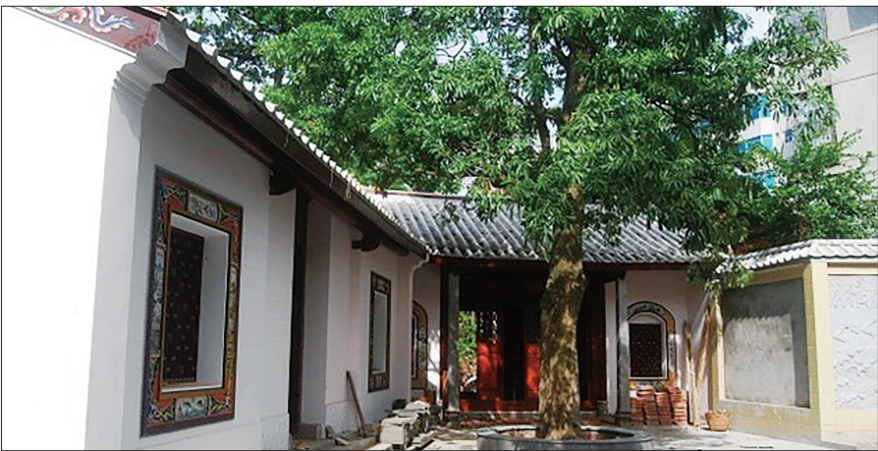
中共琼崖第一次代表大会旧址

联近20家博物馆,推动博物馆旅游持续火热。打造东坡书院、中国(海南)南海博物馆等38个文化旅游景区,评定9个国家级夜间文化和旅游消费集聚区,海口市龙华区—秀英区入选国家文化产业园和旅游产业融合发展示范区建设单位名单。 推进社会文物管理,推动中国海南国际文物艺术品交易中心在三亚挂牌,指导中国海南国际文物艺术品交易中心引进展览等,出台《海南省文物经营管理办法》。 宣传推介扩大影响,常态化开展“国际博物馆日”“文化和自然遗产日”活动;举办四届海上丝绸之路水下文化遗产保护论坛、三届中国(海南)东坡文化旅游大会,通过推文、短视频、直播等方式讲好海南文物故事,让海南本土文化走向全国、走向世界。 “十五五”开新局,海南将贯彻落实党的二十届四中全会精神,继续以敬畏之心守护文化遗产,以创新之力激活文物价值,为海南自由贸易港建设注入更深沉、更持久的文化力量。