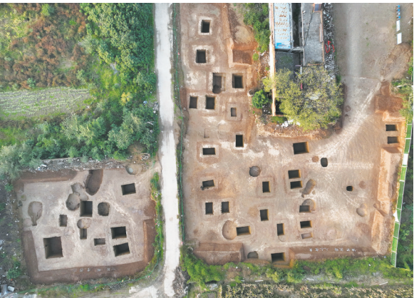
七社遗址发掘区航拍(上为北)

出土遗物有陶器、石器两类。陶器绝大多数为夹砂灰陶，次为泥质灰陶，个别夹砂红陶。纹饰以绳纹为主，少量旋纹、附加堆纹。器类主要有鬲、大口尊、假腹豆、捏口罐、圆腹罐、盆、瓮、红陶缸等。石器有穿孔石刀、石镞。鬲与大口尊时代特征鲜明，鬲折沿为主，少量卷折沿，圆唇或尖圆唇，束颈，腹垂鼓，裆较高，尖锥状足，器身饰较细的竖向绳纹，裆部饰横向绳纹，足根素面。大口尊口径明显大于肩颈。器物年代在二里岗下层文化偏晚阶段。