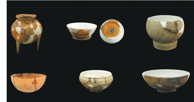
出土的新石器时代陶器

沿鼓腹、圆锥形鼎足的特征，均表明其与下王岗第一期遗存存在密切联系，年代可能为距今6500~6900年。同时，出土的部分大溪文化、汤家岗文化因素反映出长江中游地区区域内存在文化之间的交流融合。