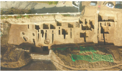
规划六路墓地全景(上为北)

M5斜坡墓道单天井单砖室墓。位于发掘区域的西部。墓道被M4打破。墓向173°。现存墓口距地表2.9米，通长9.08米，由墓道、过洞、天井、甬道