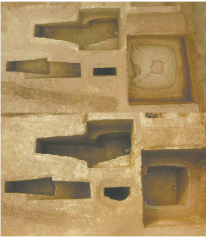
M5清理前、后全景(上为西)