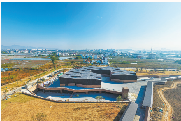
上山遗址博物馆主体竣工

2025年6月,上山国家考古遗址公园成功评定,成为此次浙江省唯一入选的“国家级”考古遗址公园。自2013年启动省级考古遗址公园建设以来,浦江县先后完成渠南砖厂等工厂搬迁、遗址核心区土地征收、上山遗址保护与利用一