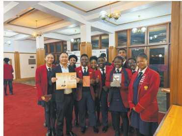
上山文化走进南非

上山文化昭示了浙江在人类童蒙时期的灿烂文明,体现了这片神奇土地自古以来的创造活力,已成为探索中华文明根系的重要坐标,持续刷新着人类农业史与文明史的认知边界。浦江县将坚持“保护第一、加强管理、挖掘价值、有效利用、让文物活起来”的工作要求,聚力协同、攻坚奋进,不断书写新时代上山文化新篇章,为打造“万年中国”重要文化标识、提升中华文明影响力贡献上山力量。