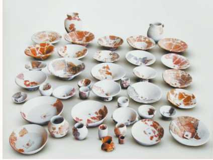
上山文化时期器物