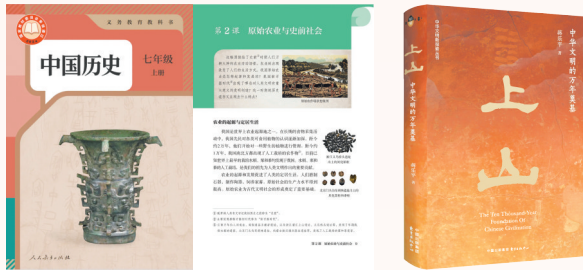
上山文化内容编入全国义务教育统编教材《中国历史》(七年级上册) 《上山——中华文明的万年奠基》

跨界联动,活化利用凸显成效。以“文化+快递”形式,将上山文化作为省域文化标识融入由浙江发往七大洲、190