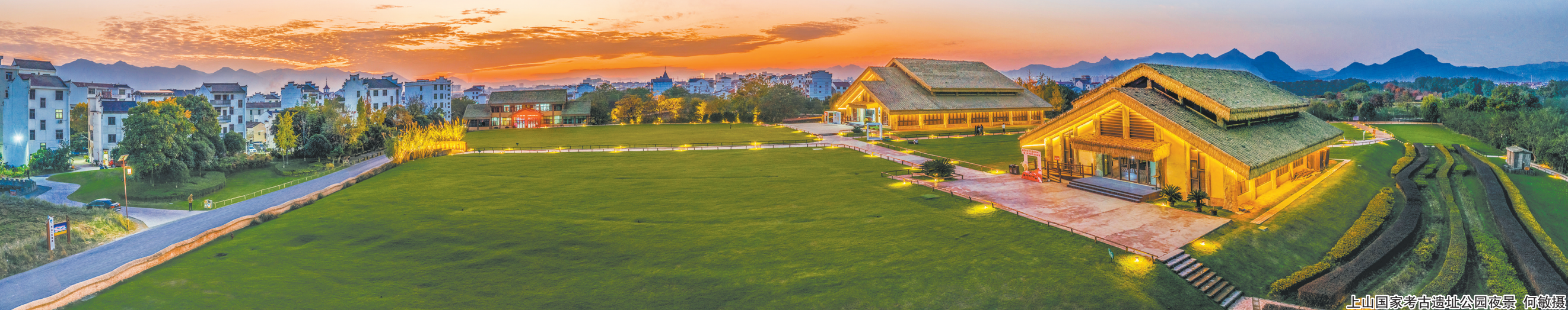
上山国家考古遗址公园夜景