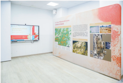
“文明的万年稻源”上山文化展览展示西班牙

余个国家及地区的顺丰快递信封,包装总计达1亿次。融入联名壁纸传递到全球4亿vivo手机用户,覆盖60余个国家及地区。与中国水稻研究所等机构合作开展“上山年代稻种”保护与展示项目,建立田间稻作博物馆作为稻种资源载体,为展示现代水稻品种改良、发展提供科普基地。联动文旅企业开发“万年上山 诗画浦江”主题旅游线路,将上山国家考古遗址公园与周边乡村旅游资源串联,推出“稻田研学”“考古体验”“非遗手作”等特色文旅产品,打造集文化体验、科普教育、休闲度假于一体的文旅融合研学游,累计接待游客超210万人次,每年带动周边乡村增收超100万元。同时,积极探索“文化+科技”融合路径,运用人工智能、大数据等技术建设上山遗址博物馆,配合省级部门整合考古数据、学术成果、影像资料等资源,为参观者、研究者提供便捷数据服务,也为公众呈现可交互、可感知的数字文化空间,让沉睡的万年文化遗产在数字时代焕发新的生命力。