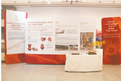
上山文化亮相泰国