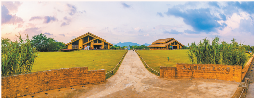
上山国家考古遗址公园

近年来,浦江县全力推进上山文化遗址的保护、研究、宣传和申遗工作,取得了一系列重要成就。上山遗址入选中国“百年百大考古发现”,列入国家《大遗址保护利用“十四五”专项规划》和“考古中国”重大项目,上山文化遗址群列入《中国世界文化遗产预备名单》,上山国家考古遗址公园评定挂牌……具有鲜明辨识度的“万年上山”金名片愈发亮丽。