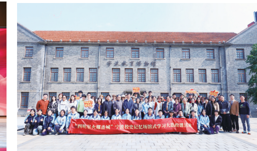
“四明星火耀甬城”宁波校史记忆场馆式学习“大思政课”活动

各类宣讲121次,形成“修复—讲述—传播”的全链条育人模式。该项目不仅实现了红色文物的物理保护,更通过故事的挖掘与传播,让革命精神跨越时空,成为培育文化自信的生动教材。