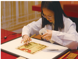
宁波财经学院学子正在修复红色文物

在顶层设计方面,宁波构建起“党委领导、政府主导、部门协同、高校支撑、社会参与”的工作格局,以《浙东片区革命文物保护利用专项规划》编制为契机,出台《宁波市革命遗址保护利用规定》,将革命文物工作纳入全市文化发展战略与教育事业规划。持续投入专项资金,形成政策护航、资金保障、标准引领的长效工作机制,推动全市革命文物保护修缮、展陈提升。数字化建设与思政课程开发。通过革命文物的活态传承,强化文化自信,培育社会主义核心价值观,为实现中华民族伟大复兴的中国梦提供精神动力。