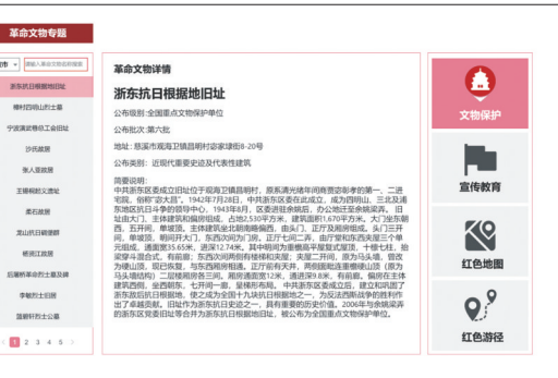
宁波市革命文物专题数据库

“我为烈士修遗物”志愿项目由宁波财经学院“甬城文保”实践团发起并实施,2019年至2025年修复革命文物41件,惠及服务对象89240人次,衍生红色故事102篇,开展