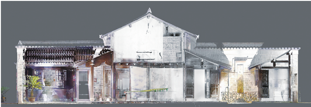
李敏烈士旧居三维激光扫描模型