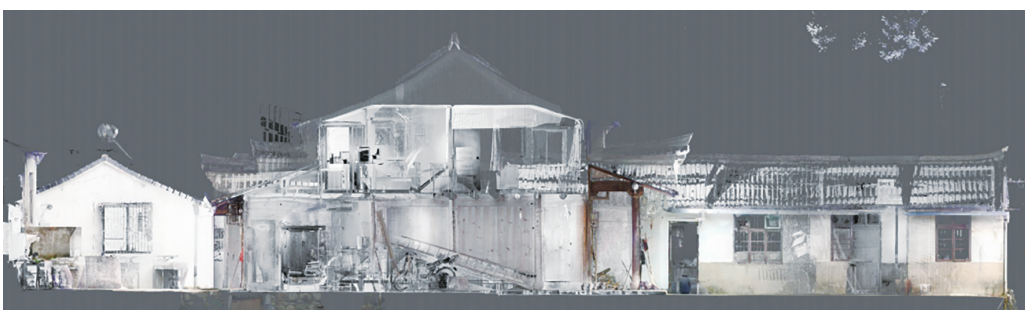
袁马三北游击司令部旧址三维激光扫描模型