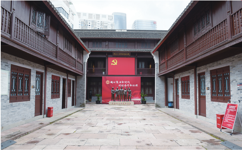
宁波工人运动史料陈列室