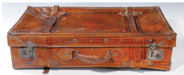
民国冯和兰烈士生前使用的手提皮箱