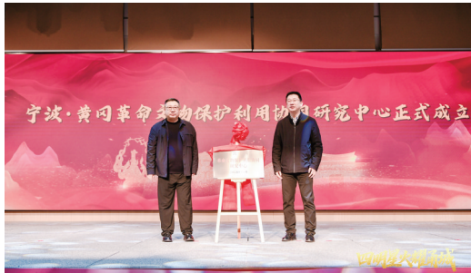
宁波·黄冈革命文物保护利用协同研究中心成立仪式