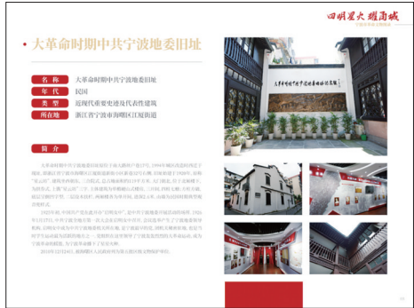
“四明星火耀甬城”宁波市革命文物图录