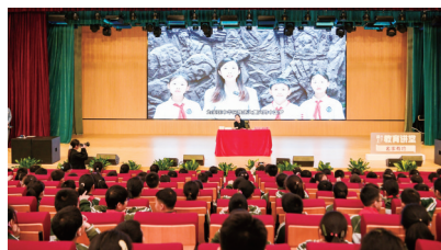
“互联网+爱国主义教育”云课堂