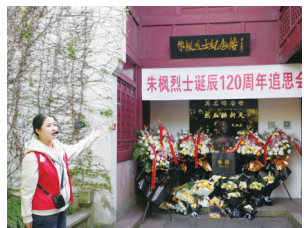
学生们走进朱枫烈士纪念馆