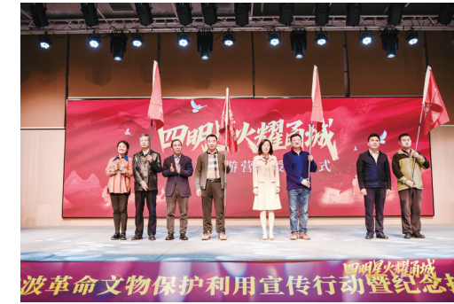
“四明星火耀甬城”红色研学游营地授旗仪式