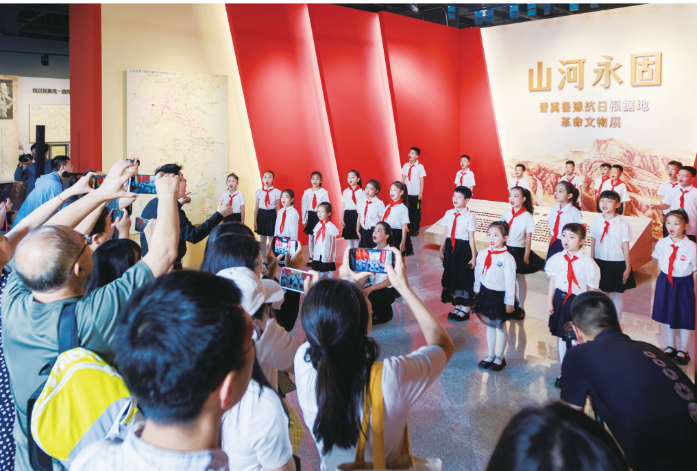
“山河永固”七一红色研学活动

隐蔽战线,无名英雄铸就伟大功勋。与山西省国家安全厅、山西省文学艺术界联合会共同举办的“岂曰无名 山河为证——纪念抗战胜利80周年党的隐蔽战线主题展”,系统呈现了抗战时期党的隐蔽战线在山西及华北地区的斗争历程,不仅展示了党的隐蔽战线工作者在抗战时期的英勇事迹,还同步推出了“无声功勋 笔墨