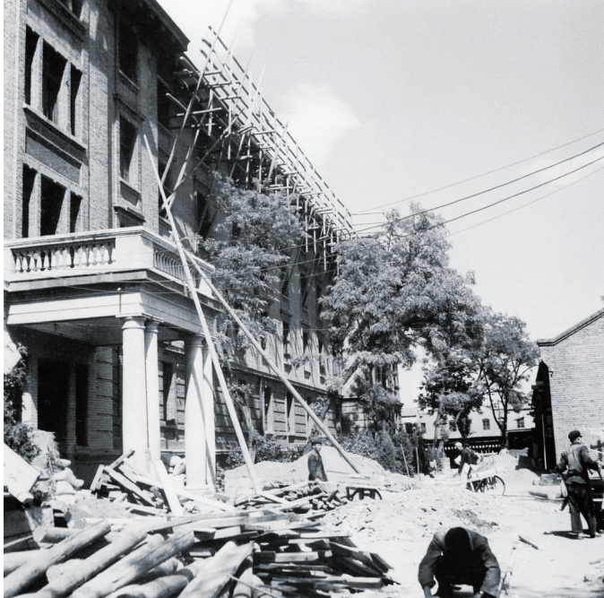
北大红楼抗震加固维修现场