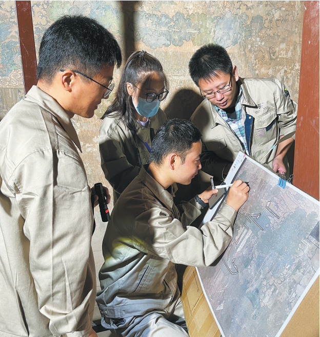
2021 年,古建筑壁画保护修复研修班现场调查

自 2002 年起,伴随中国、意大利合作文物保护修复培训项目的启动,中国文化遗产研究院(此一时期名为中国文物研究所)组建修复培训中心,在文物保护人才培养方面步入专业化、