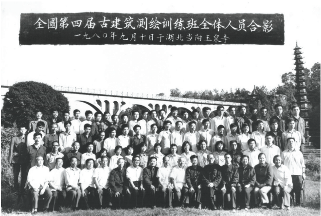
全国第四届古建筑测绘训练班