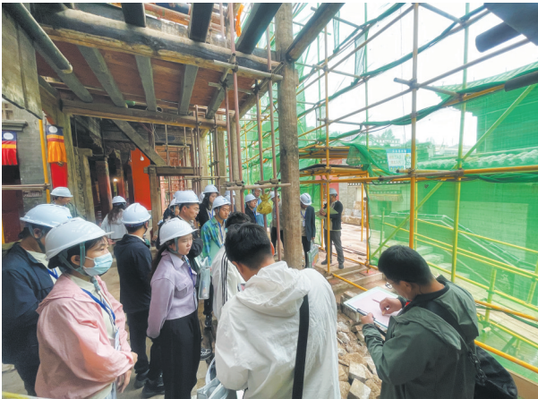
2025 年,藏式建筑文物保护修复培训班塔尔寺大经堂现场教学

2021 年在国家文物局对全国第一批文博人才培训示范基地开展运行评估时,中国文化遗产研究院凭借健全的组织管理机构以及在人才培养与教学研究方面的显著成效,以评估总分第一名的成绩获评 A。10 年来,为夯实基础建设,中国文化遗产研究院先后与高校、科研院所等机构签署合作协议,在人才培养领域进行了深入合作。与中国知网合作开展了“中国文化遗产研究院教育培训网校”建设,实现了教育培训信息化管理。出版了《考古现场保护概论》《纺织品文物保护修复概论》《纸质文物保护修复概论》《文化遗产防灾减灾概论》等专业教材,为支撑文物修复师水平认定工作而规划编制的 14 本