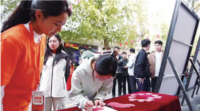
东北财经大学学生参与沉浸式互动