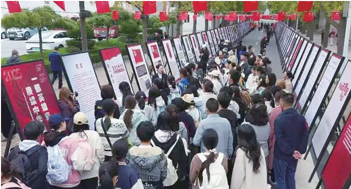
东北财经大学学生参观展览