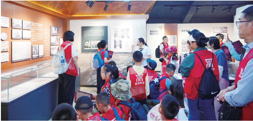
南侨机工主题研学思政课