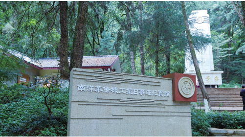
昆明市博物馆南侨机工分馆(南洋华侨机工抗日事迹纪实馆)