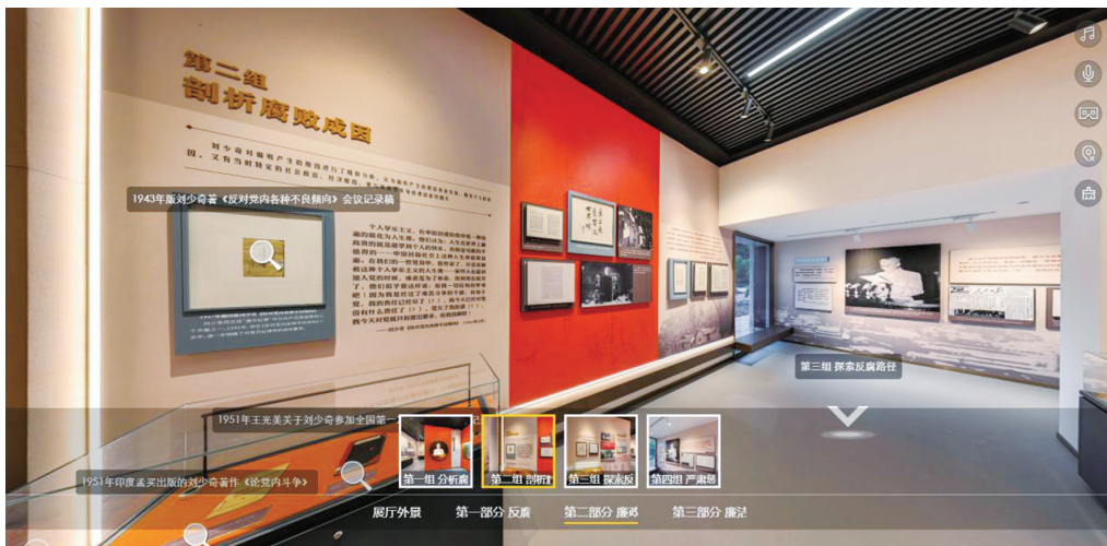
数字化展览“廉洁奉公的光辉榜样”

刘少奇同志纪念馆作为中华民族文化基因库红色基因库建设试点单位，重点推进红色基因库建设与可移动文物数字化工程，为智慧博物馆建设发展提供重要数据支撑。一是该馆对