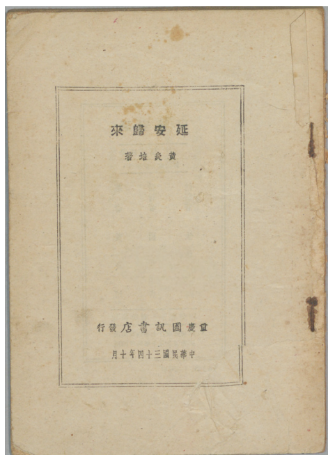
黄炎培著《延安归来》1945年10月重庆国讯书店出版 香山革命纪念馆藏