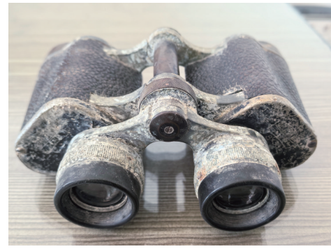
方志敏使用的望远镜(中国人民解放军65426部队藏)