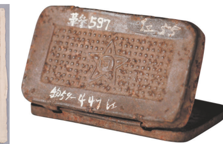
烟盒(浙江省博物馆藏)