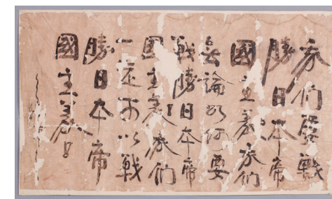
1937年刘英为平阳抗日救亡学校题词(中国人民革命军事博物馆藏)