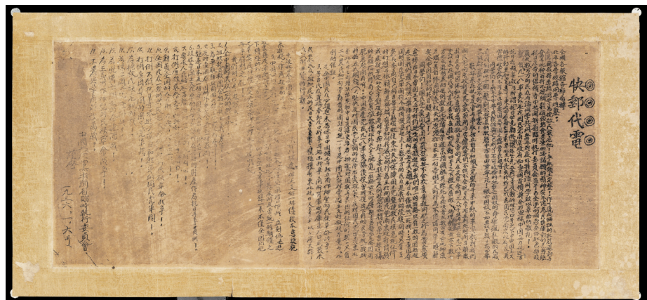
1936年中国共产党浙闽省临时执行委员会关于抗日的快邮代电(浙江省博物馆藏)